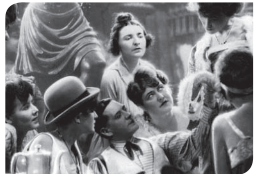
L'Opéra de quat'sous