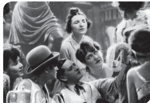
L'Opéra de quat'sous